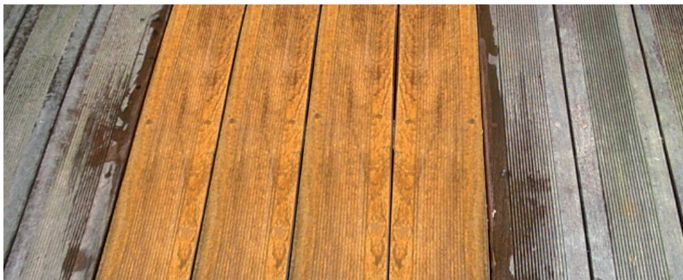
Applicazione su listoni scanalati di un pontile in legno – Owatrol Aquanett –