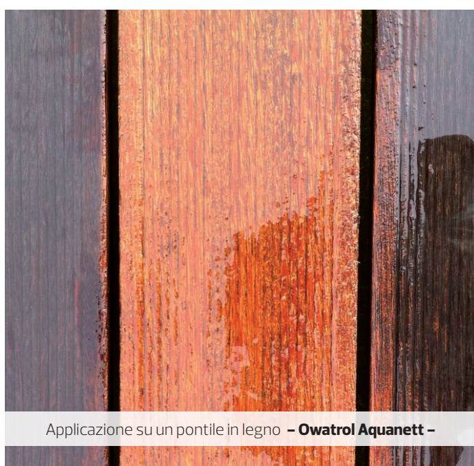
Applicazione su un pontile in legno – Owatrol Aquanett –

ra bagnato, neutralizzare con NET-TROL. Dopo l'essiccazione completa del supporto, carteggiare il legno se necessario (grana 100).