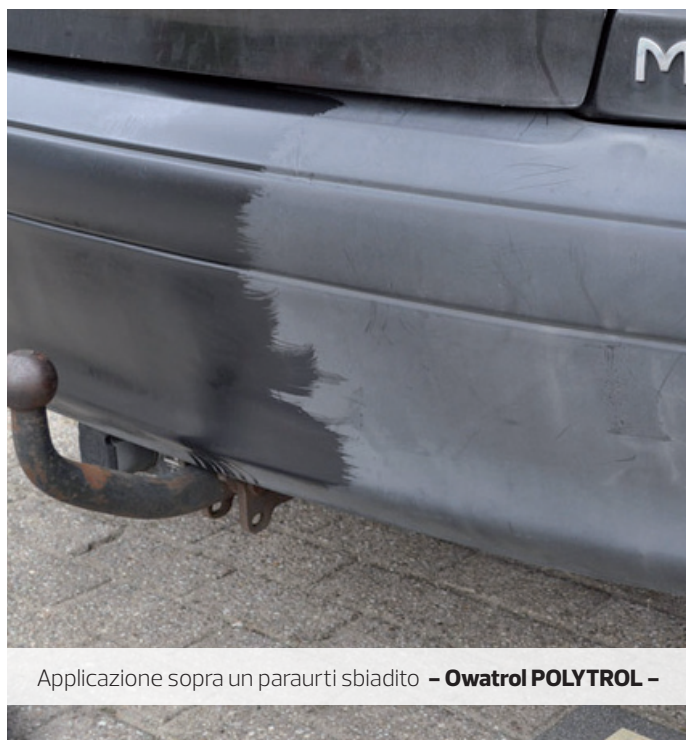
Applicazione sopra un paraurti sbiadito – Owatrol POLYTROL –

● In Generale: Le superfici devono essere pulite, asciutte e prive di tracce di sporco. Tutte le cere, i polish, i siliconi eventualmente presenti devono essere completamente rimossi. Le muffe devono essere trattate con una soluzione 50/50 di acqua e candeggina. Sfregare la soluzione sulla superficie e lasciare agire per 10-15 minuti, risciacquare con cura.