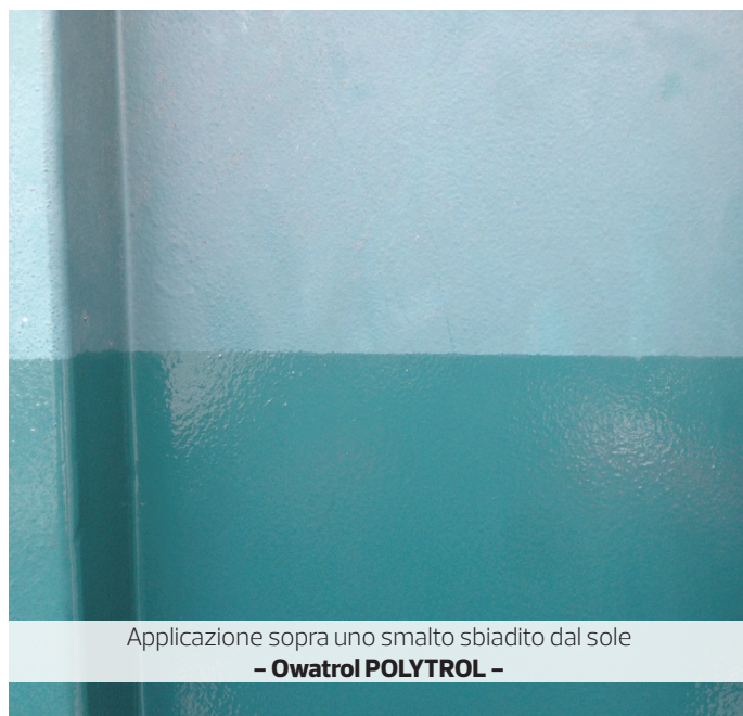
Applicazione sopra uno smalto sbiadito dal sole – Owatrol POLYTROL –

● Plastica, gelcoat, tegole, superfici pitturate, ecc: Pulire la superficie con acqua tiepida e sapone o con NET-TROL. Risciacquare con cura e lasciare asciugare per almeno 12 ore.